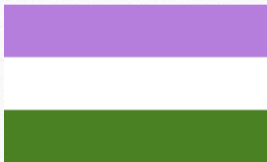
Gender queer flagga