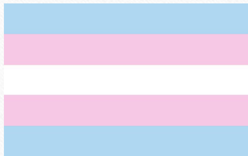
Transgender Pride Flagga